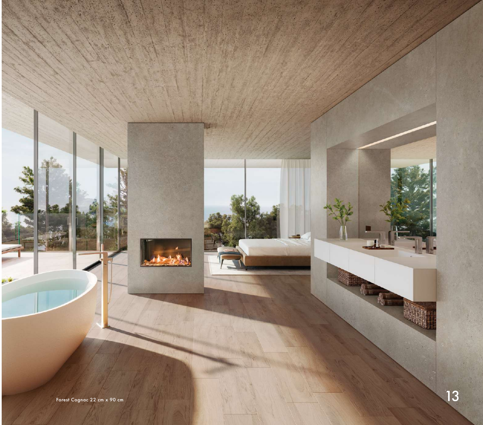
Forest Cognac 22 cm x 90 cm