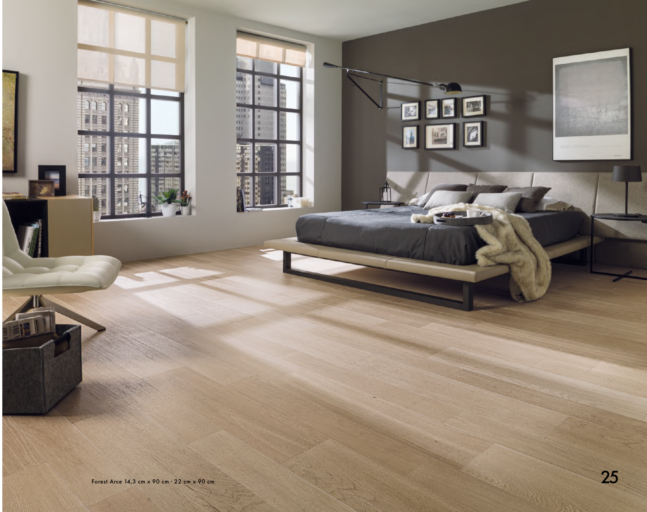
Forest Arce 14,3 cm x 90 cm · 22 cm x 90 cm