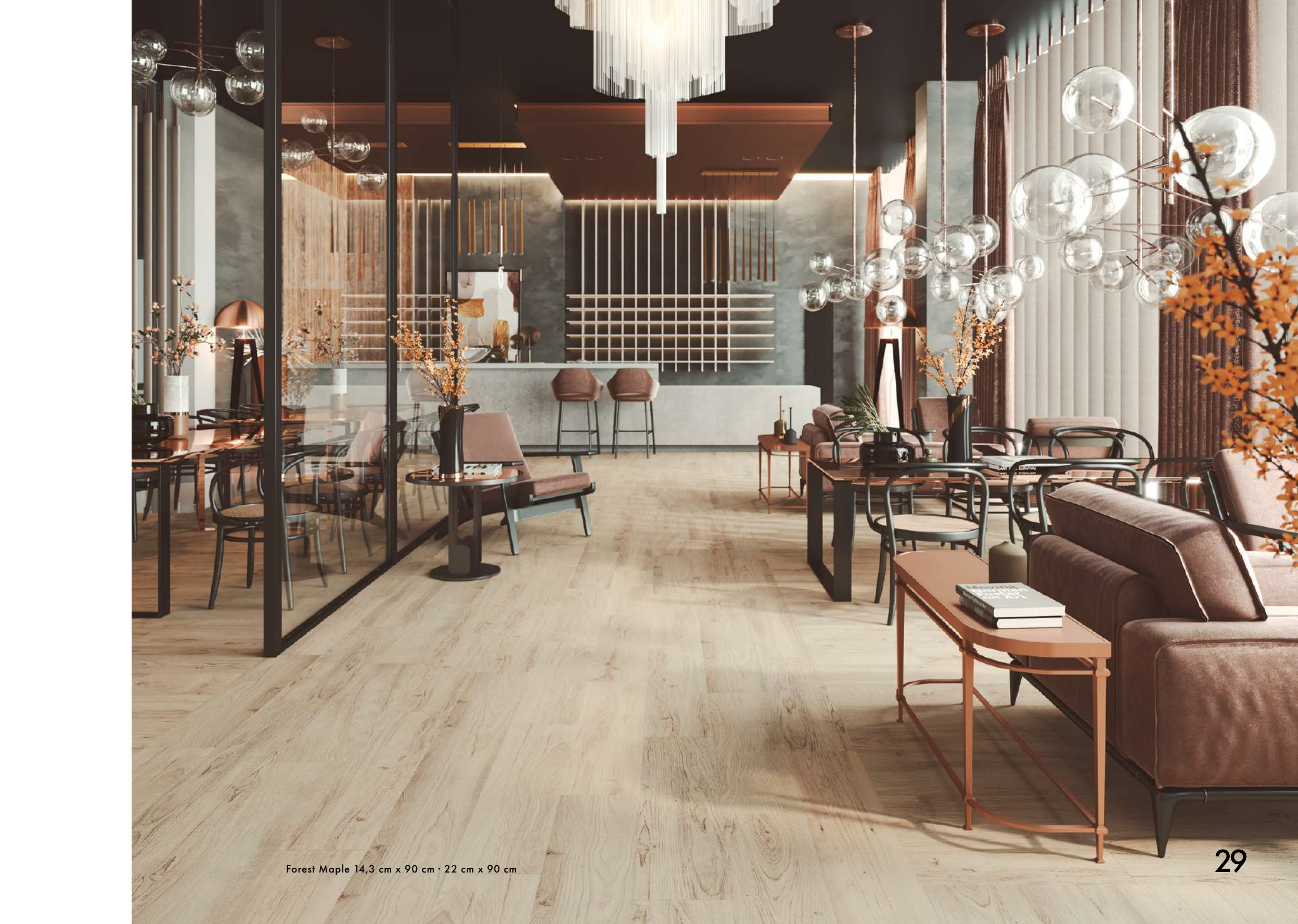
Forest Maple 14,3 cm x 90 cm · 22 cm x 90 cm