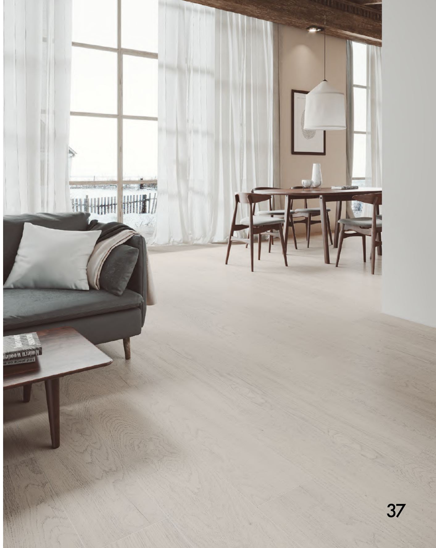
Forest Fresno 22 cm x 90 cm