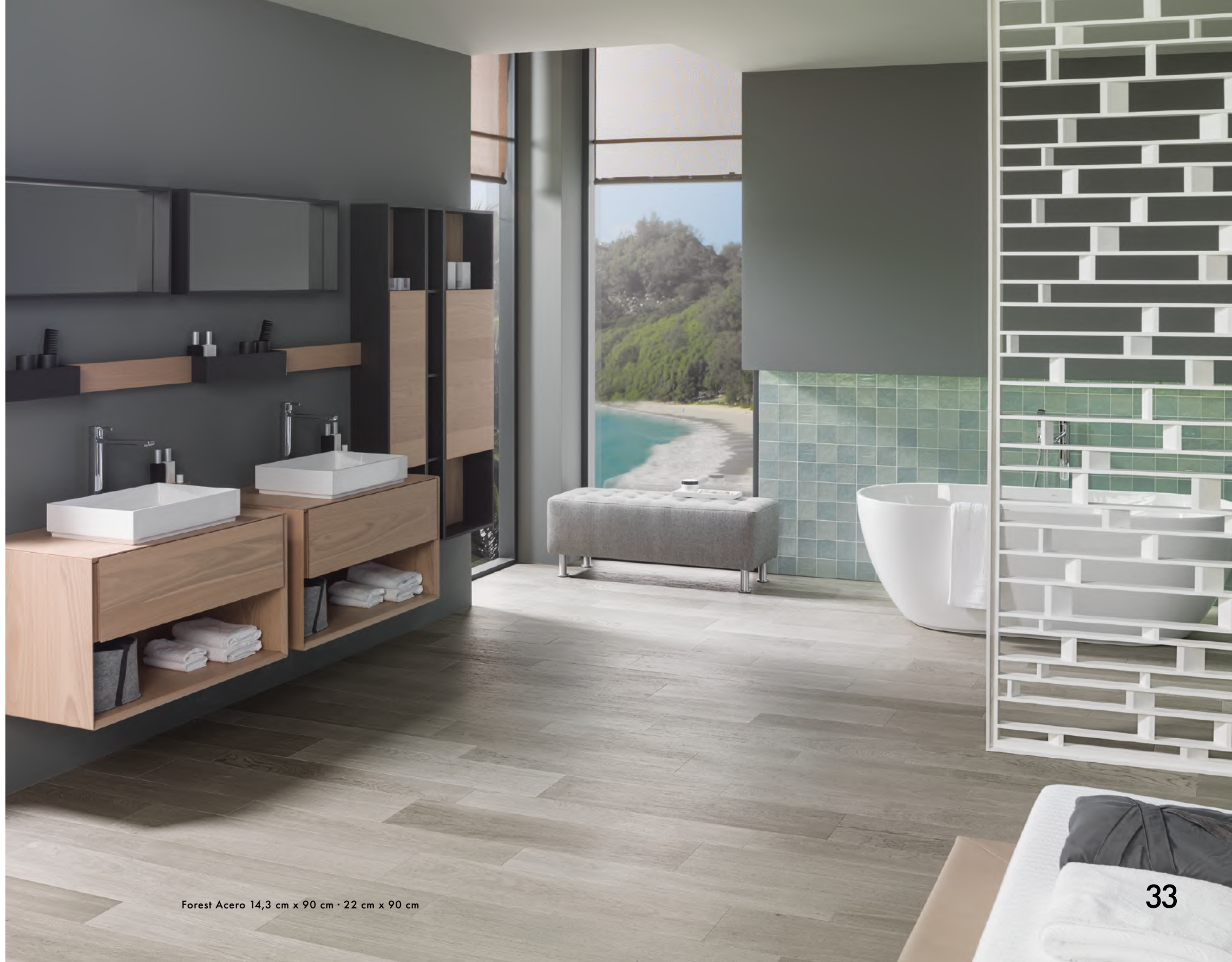
Forest Acero 14,3 cm x 90 cm · 22 cm x 90 cm