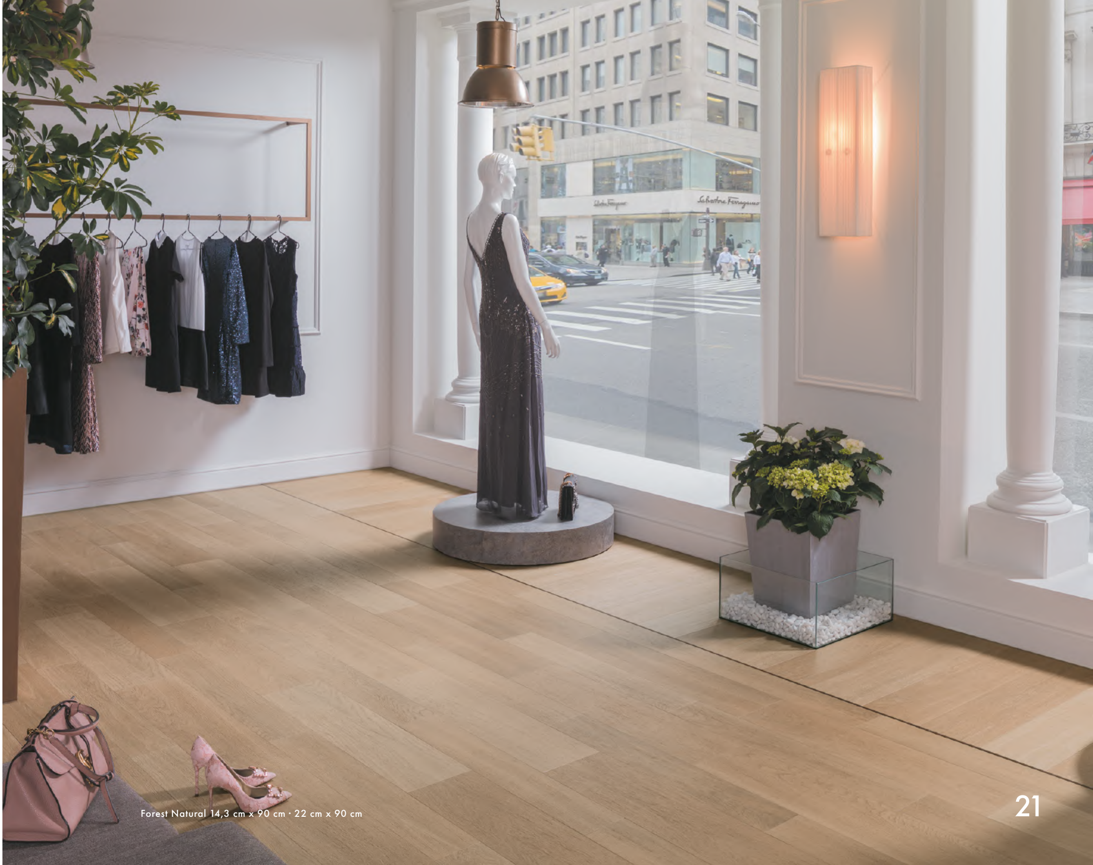
Forest Natural 14,3 cm x 90 cm · 22 cm x 90 cm