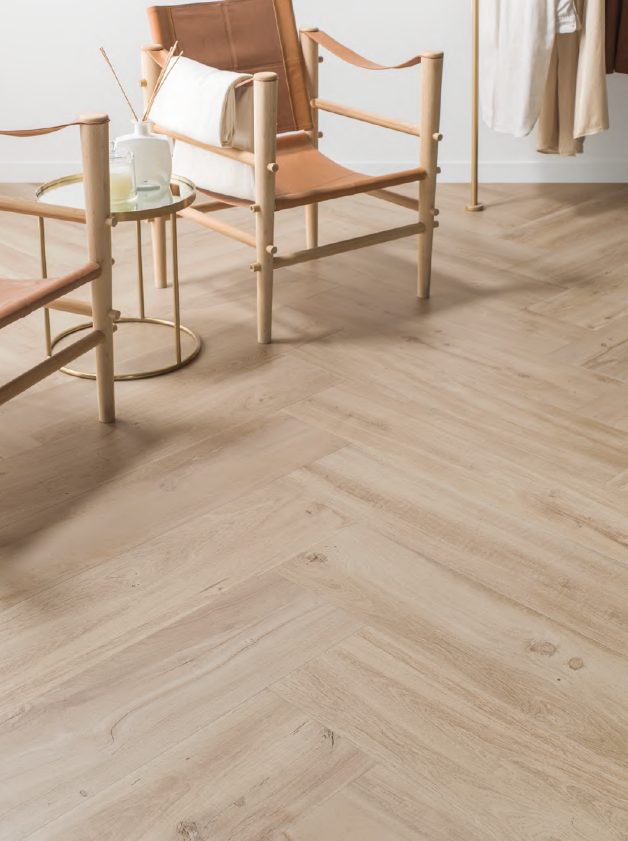
Forest Arce 22 cm x 90 cm

Madera cerámica como solución a cualquier proyecto que busque excelencia, funcionalidad y calidez. Hace alrededor de tres años que el parquet cerámico ganó aún más fuerza en el sector del interiorismo gracias a la versatilidad y las virtudes que presenta respecto a otros materiales.