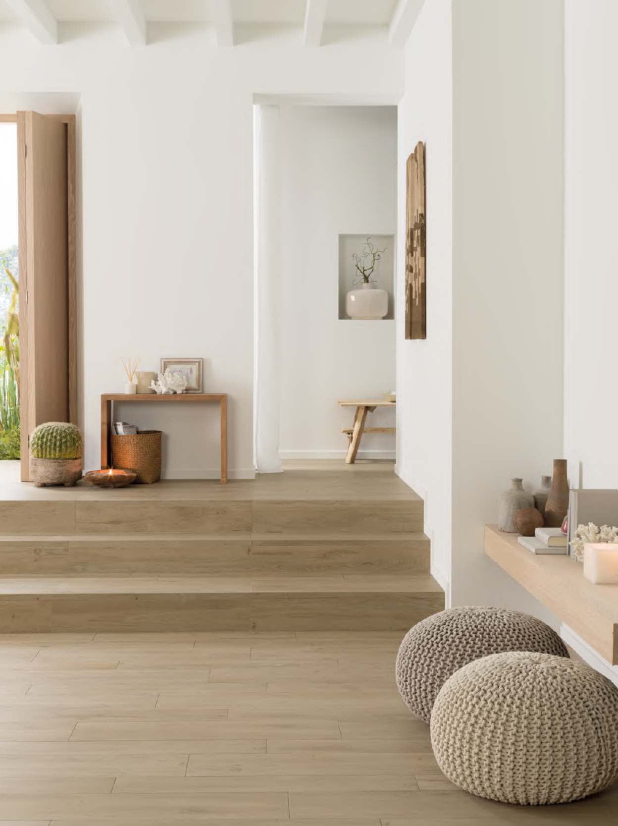
Forest Maple 14,3 cm x 90 cm · 22 cm x 90 cm