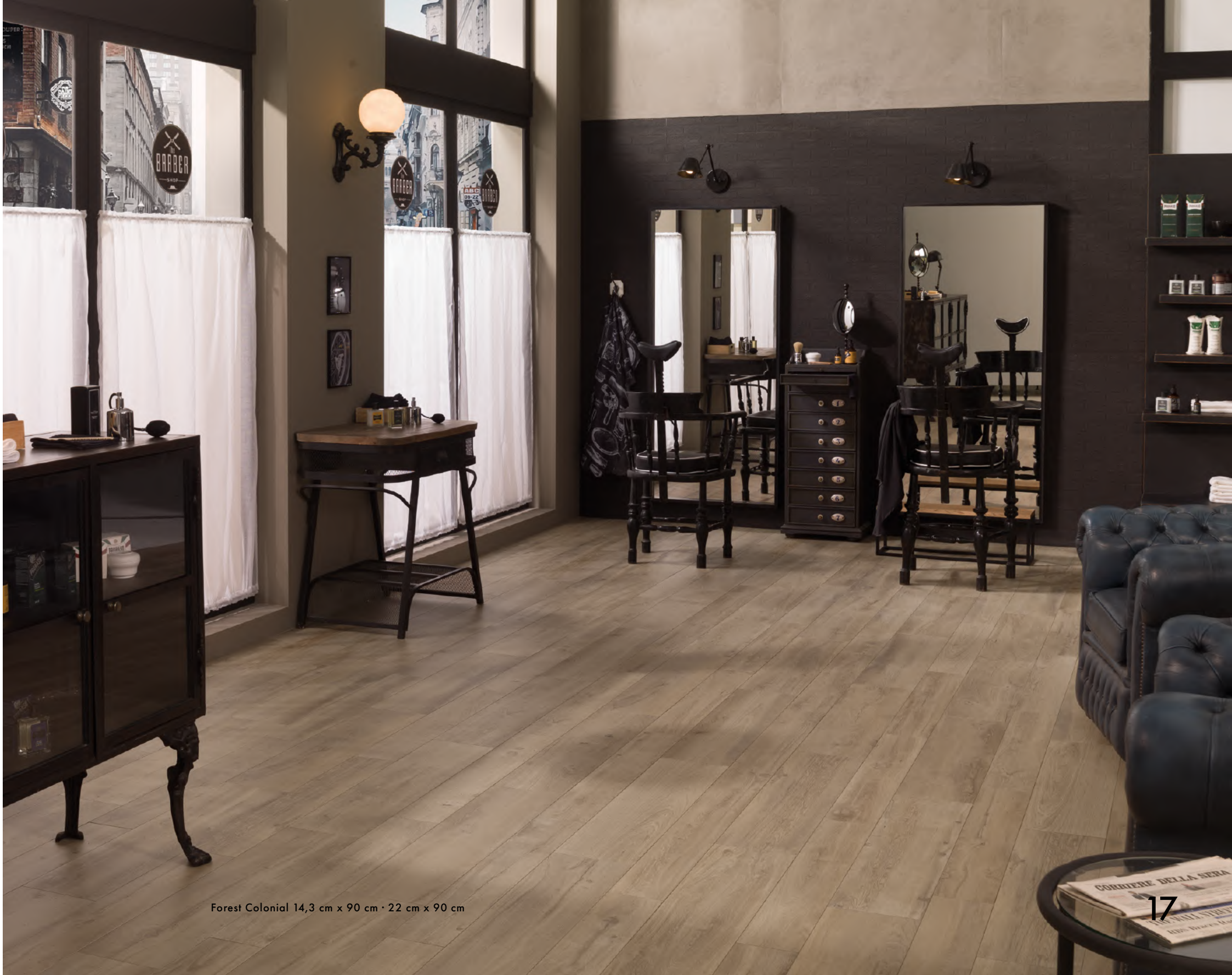
Forest Colonial 14,3 cm x 90 cm · 22 cm x 90 cm