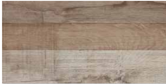
GLV 0E2 LEGNO VINTAGE BEIGE 30X60 RETTIFICATO ■ 33