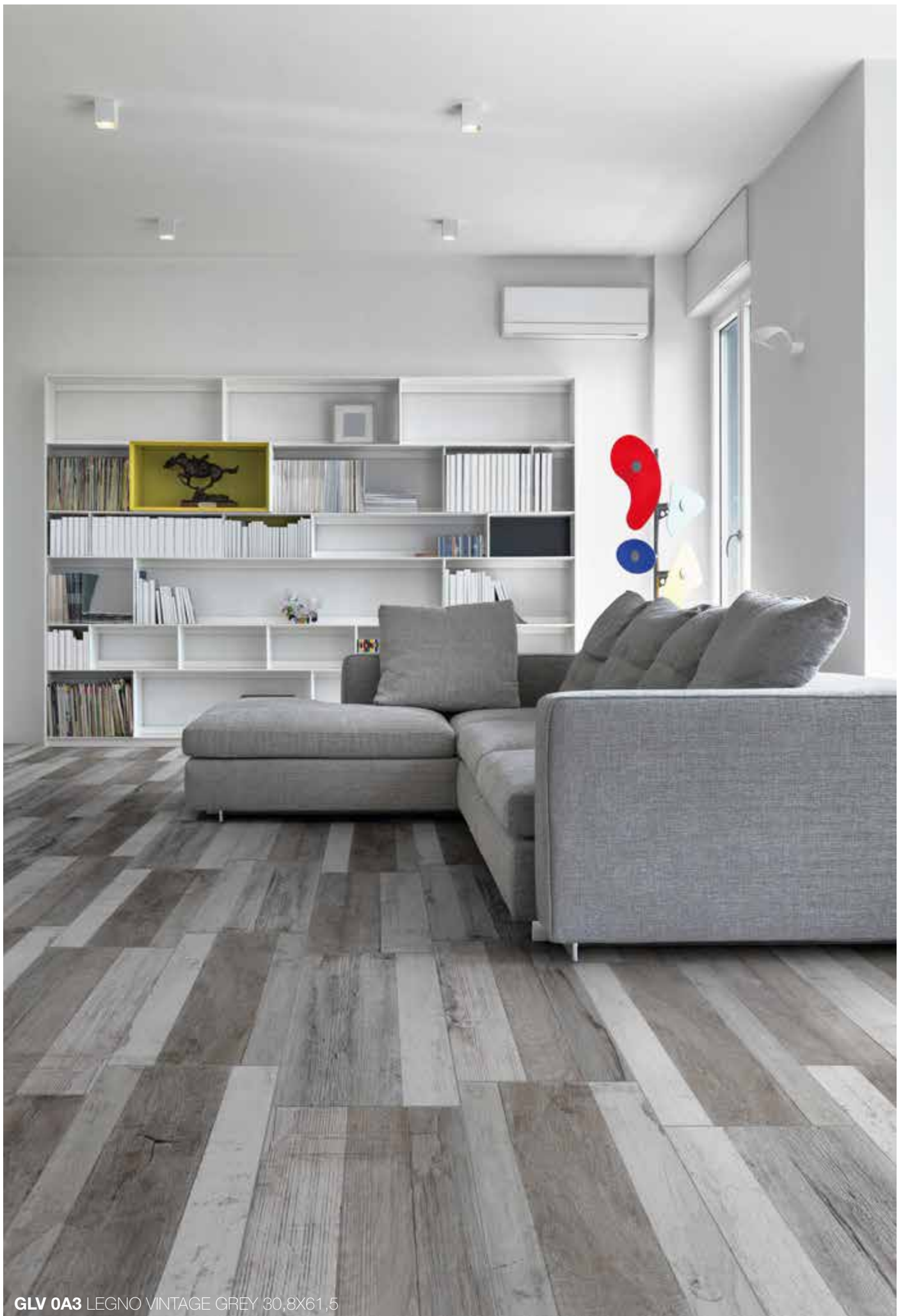
GLV 0A3 LEGNO VINTAGE GREY 30,8X61,5