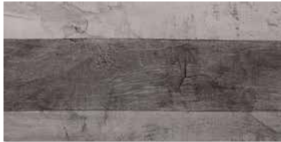
GLV 0E3 LEGNO VINTAGE GREY 30X60 RETTIFICATO ■ 33