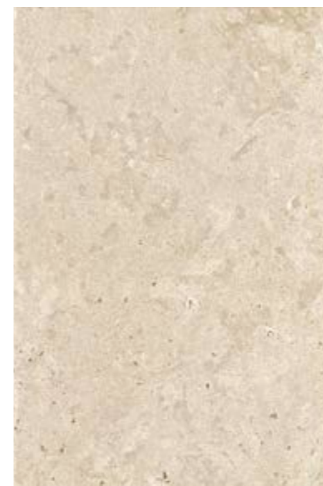
4200944 • 40,5X61/16"x24" R10 ■ 126 4201181 • 40,5X61/16"x24" R11 ■ 126