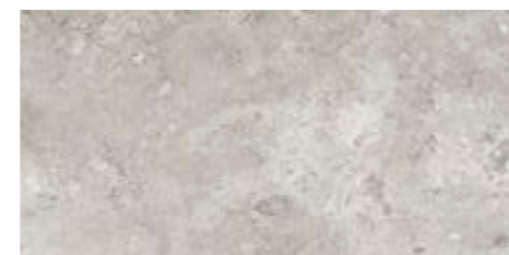
4200937 • 20X40,5/8"x16" R10 ■ 157