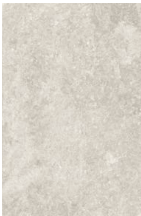
4200943 • 40,5X61/16"x24" R10 ■ 126 4201180 • 40,5X61/16"x24" R11 ■ 126