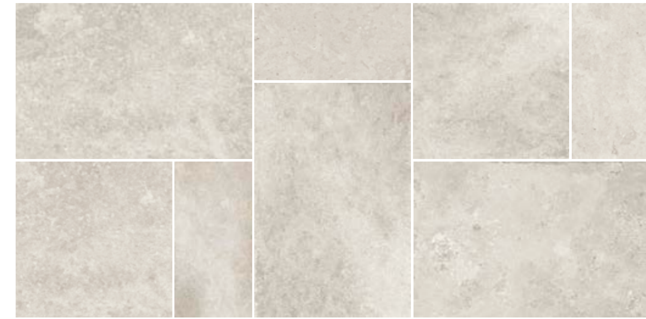
4200897 • BOX MULTIFORMATO BIANCO R10 ■ 157