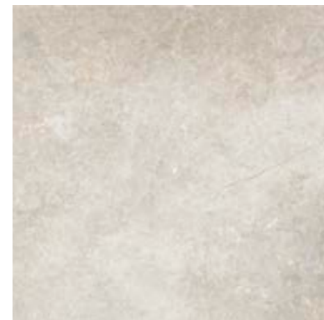
4200939 • 40,5X40,5/16"x16" R10 ■ 157