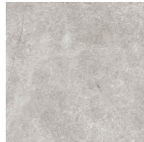
4200941 • 40,5X40,5/16"x16" R10 ■ 157