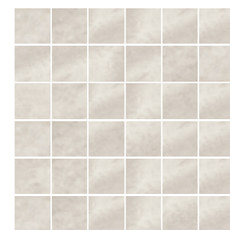
4200951 • MOSAICO ▲ 37