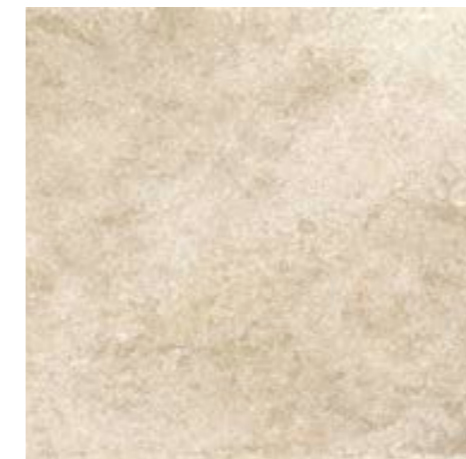
4200940 • 40,5X40,5/16"x16" R10 ■ 157