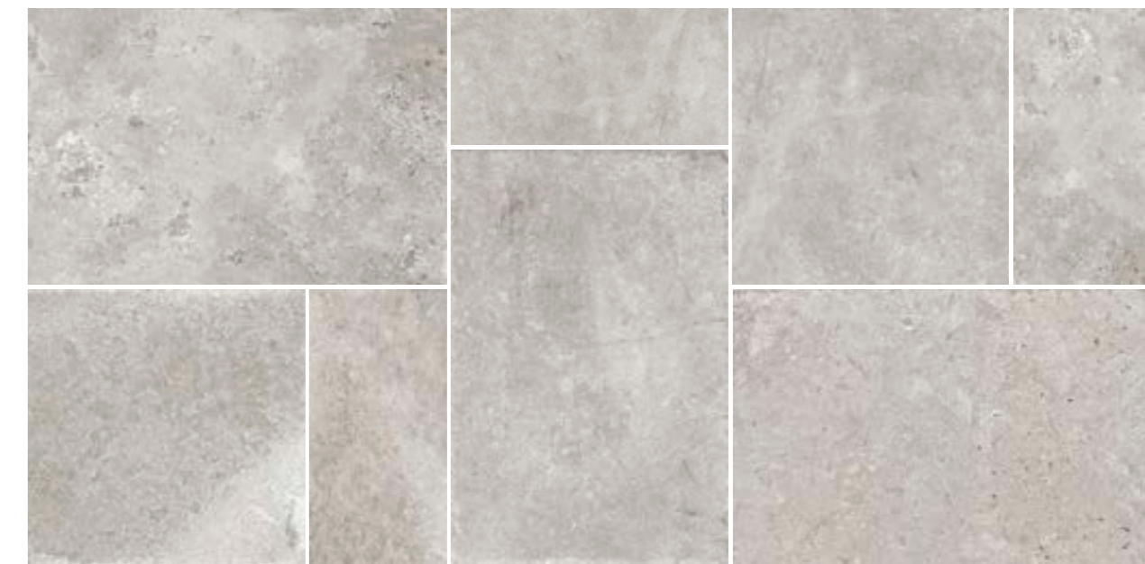
4200899 • BOX MULTIFORMATO GRIGIO R10 ■ 157