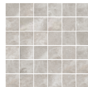
4200953 • MOSAICO ▲ 37