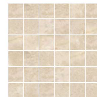
4200952 • MOSAICO ▲ 37