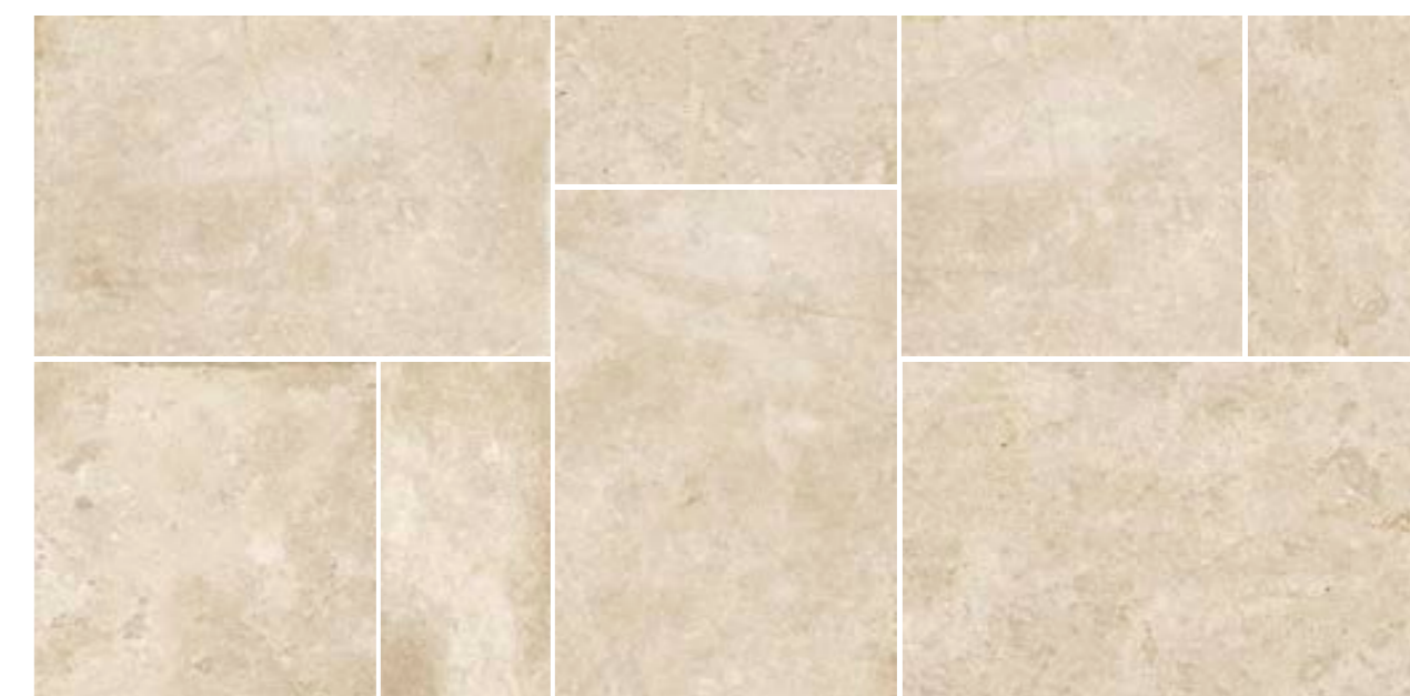
4200898 • BOX MULTIFORMATO BEIGE R10 ■ 157