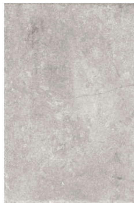
4200945 • 40,5X61/16"x24" R10 ■ 126 4201182 • 40,5X61/16"x24" R11 ■ 126